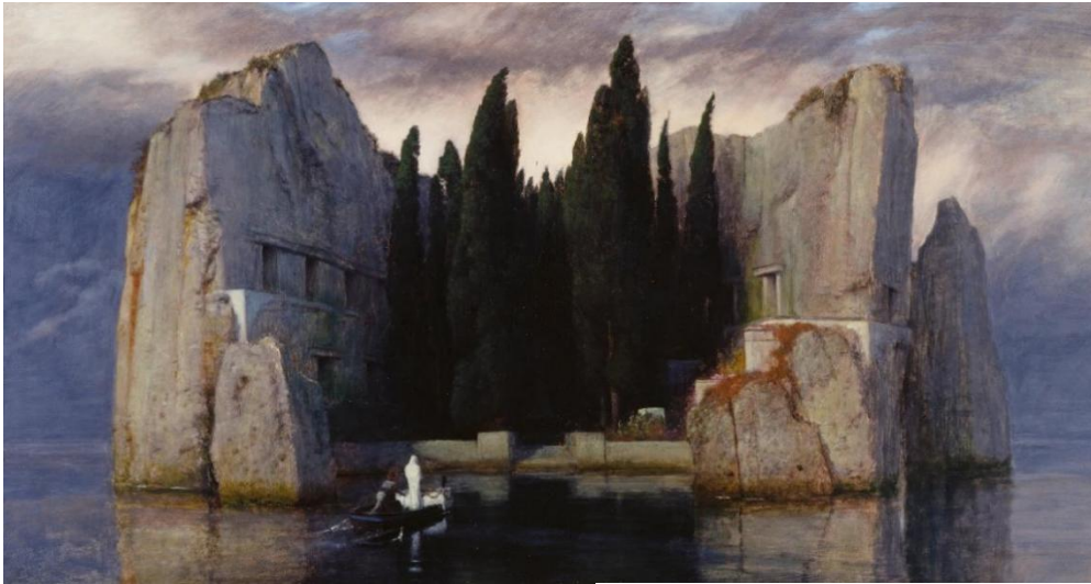
Arnold Böcklin: Otok mrtvih (tretja verzija), olje na lesu, 1883, 111 x 155 cm