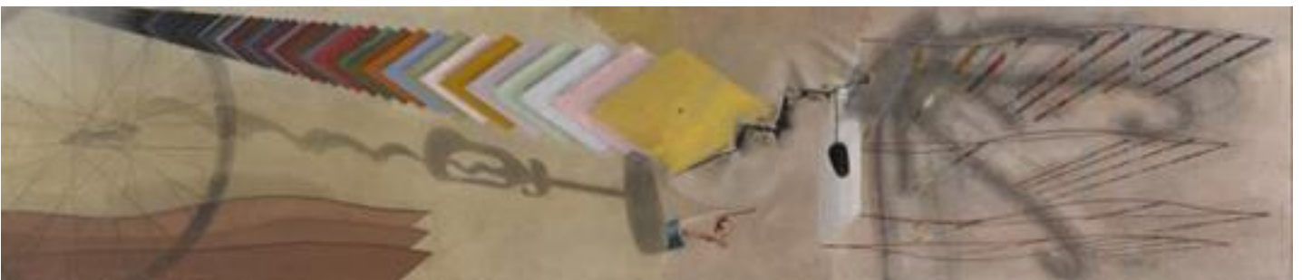
Marcel Duchamp: Tu m' , olje na platnu, krtačka za steklenice, ki je instalirana iz raztrganine na platnu, 1918, 69.8 x 303 cm