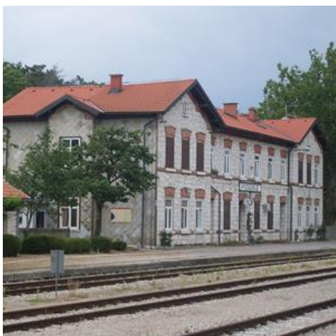
Železniška postaja Podgorje