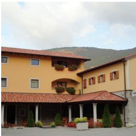
Prva lokacija sob: Gostilna in prenočišča pod Slavnikom Podgorje

Cena namestitve vključuje: tri nočitve v dvoposteljni sobi z zajtrkom. Tri kosila in tri zajtrke ter v četrtek na dan prihoda hladno večerjo. Kavno, sadje in uporabo večjega skupnega prostora v prostorih Agrarne skupnosti Podgorje (bivša osnovna šola). Obstaja možnost, da na kraju samem doplačate za enoposteljno sobo (ca 10 EUR na dan), seveda če bodo proste.