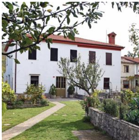
Druga lokacija sob: samostojna hiša Podgorje