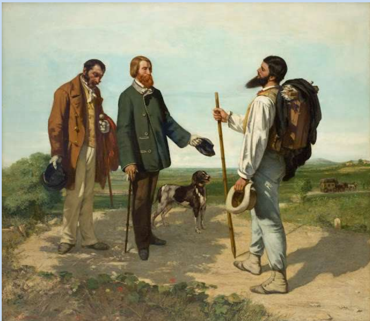
Gustave Courbet: La Rencontre, ou Bonjour Monsieur Courbet , 1854, olje na platnu

Slikarska delavnica je namenjena vsem ki imajo radi slikarstvo in slikarsko ustvarjanje.