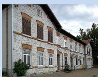
Železniška postaja Podgorje

Stojala in nekaj zlozljivih stolov si lahko udeleženci po dogovoru z mentorico izposodijo v Limbušu, kjer potekajo slikarske delavnice. Po uporabi jih nato vrnejo v ponedeljek 26. junija na mesto izposoje v Limbuš. Prevoz stojal in stolov je v lastni režiji.