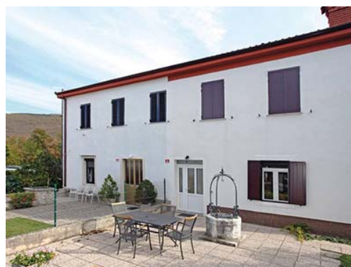
2. lokacija sob: samostojna hiša, Podgorje