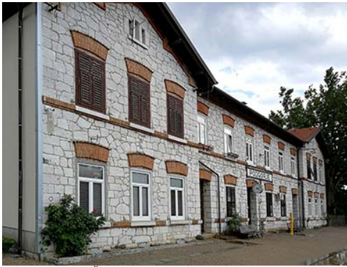
Železniška postaja Podgorje