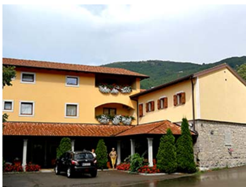
1. lokacija sob: Gostilna Pod Slavnikom , Podgorje

Ta cena vključuje: tri nočitve v dvoposteljni sobi, tri zajtrke in tri kosila v Gostilni Pod Slavnikom , hladno večerjo na dan prihoda, kavo, sadje čez dan v prostoru Agrarne skupnosti, stroške uporabe dveh skupnih prostorov: Agrarna skupnost Podgorje (bivša osnovna šola) in objekt ob igrišču. Obstaja možnost, da na kraju samem doplačate za enoposteljno sobo (ca 10 EUR na dan), seveda le če bodo proste.